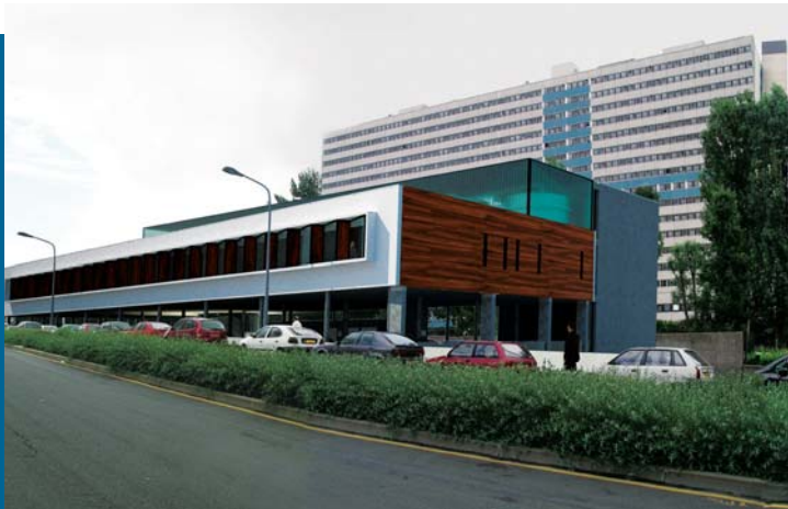
La future unité de thérapie cellulaire du CHU.