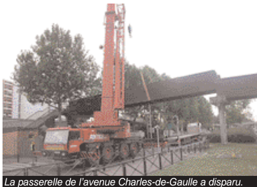
La passerelle de l'avenue Charles-de-Gaulle a disparu.

Attention travaux ! Interrompus, en partie, durant l'été, les chantiers de voirie ont repris, dès septembre, dans toute l'agglomération.