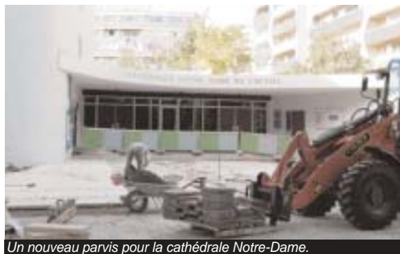
Un nouveau parvis pour la cathédrale Notre-Dame.

La mise en œuvre du programme pluriannuel des travaux de voirie se poursuit. Comme prévu, trois axes majeurs vont faire l'objet d'un réaménagement : la rue Étienne-Dolet, à Alfortville, l'avenue du Général-de-Gaulle, à Créteil, et les rues Henri-Barbusse et Louis-Pasteur, à Limeil-Brévannes. Des travaux qui mobiliseront l'essentiel des 6 millions d'euro inscrits à cet effet au budget communautaire.