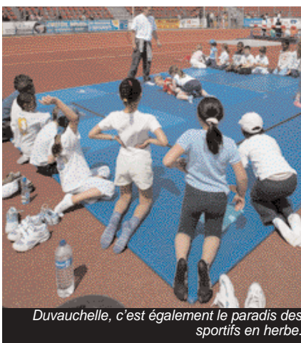
Duvauchelle, c'est également le paradis des sportifs en herbe.

Et même si le parc des sports Dominique-Duvauchelle apparaît aujourd'hui comme l'un des fleurons des équipements sportifs en Île-de-France, il n'en va pas moins connaître un nouveau développement, avec la poursuite de l'aménagement des quartiers sud de Créteil et le prolongement de la ligne 8 du métro.