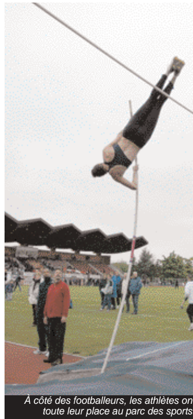
À côté des footballeurs, les athlètes ont toute leur place au parc des sports.

Le Stade de France, le Parc des Princes, Charléty et... Duvauchelle. Eh oui, avec une capacité d'accueil de 10 000 et bientôt 12 000 spectateurs, le stade Dominique-Duvauchelle est le quatrième de l'Île-de-France. Un stade, somme toute, à la mesure d'une agglomération de 140 000 habitants, et qui, dans les quartiers sud de Créteil, constitue la pierre angulaire d'un espace urbain en devenir entièrement voué au sport.