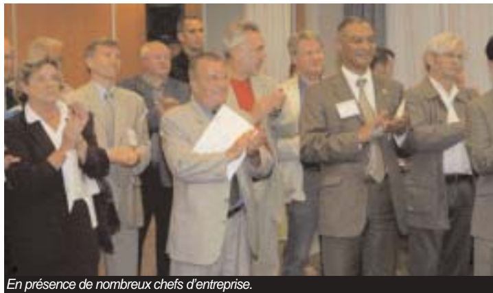
En présence de nombreux chefs d'entreprise.

Hôte du club d'entreprises, Alain Afflelou a rencontré, à Créteil, les dirigeants de la Plaine centrale.