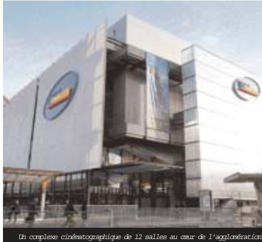
Un complexe cinématographique de 12 salles au cœur de l'agglomération.

Comme dans toutes les salles du même groupe, les cartes UGC Solo (une place valable tout le jour et à toutes les séances) et UGC Illimitée (accès illimité pendant douze mois)