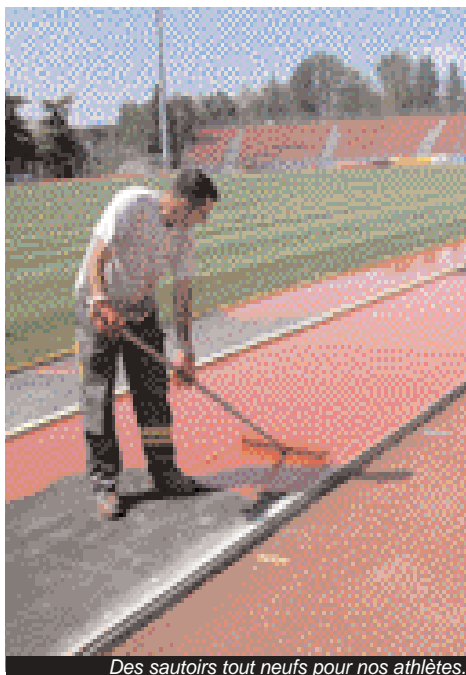
Des sautoirs tout neufs pour nos athlètes.