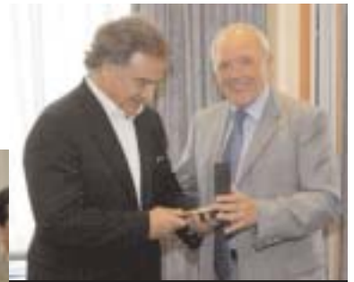
La médaille d'honneur de la Ville de Créteil à Alain Afflelou.

que par vocation. Au milieu des années 1970 c'est lui, pourtant, qui interpelle les Bordelais avec une première formule choc : “La moitié de votre monture à l'œil !”. Ses confrères se hérissent, mais ne peuvent empêcher que son chiffre d'affaires grimpe, en quelques mois, de 400% ! La suite, peu ou prou, chacun la connaît : c'est la multiplication, dans tout l'hexagone, des centres d'optique à prix cassés, les fameux messages publicitaires télé, ces hommes et ces femmes de tous âges qui se déclarent tous fous... d'Afflelou. Venu accueillir le célèbre opticien, Laurent Cathala a également salué celui qui fut président du club de football de Créteil de 1996 à 2002. Et c'est parce que ce dernier “a contribué au rayon-