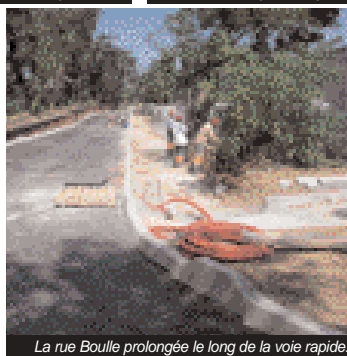
La rue Boule prolongée le long de la voie rapide.

Considérée comme l'une des artères principales d'Alfortville, la rue Étienne-Dolet dessert le lycée Maximilien-Perret, la Zac Val-de-Seine et le parc des sports du même nom. Et c'est dans sa partie comprise entre la digue d'Alfortville et la place San-Benedetto-del-Tronto qu'elle fait l'objet de travaux destinés, notamment, à la transformer en zone 30 (vitesse limitée à 30 km/heure) et à sécuriser le cheminement des cyclistes. Au programme, figurent ainsi la réduction de la largeur de la chaussée et la création d'un itinéraire cyclable, mais aussi l'enfouissement des réseaux (électriques et de télécommunication) et la rénovation de la