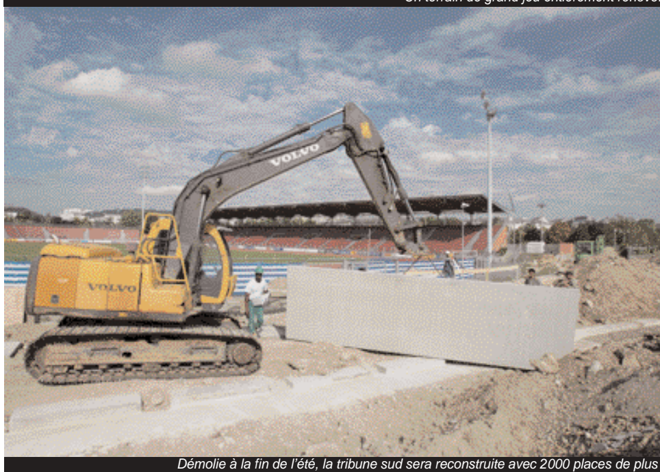
Démolie à la fin de l'été, la tribune sud sera reconstruite avec 2000 places de plus.

Pour l'heure, c'est en vue de l'homologation du terrain d'honneur par la Ligue que la tribune sud est en cours d'agrandissement, de manière à porter sa capacité de 1062 à 2950 places assises. C'est au même titre que, l'an passé, les projecteurs avaient été changés, augmentant l'éclairage de 640 à 1000 lux.