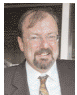
... à Michel Camy-Peyret