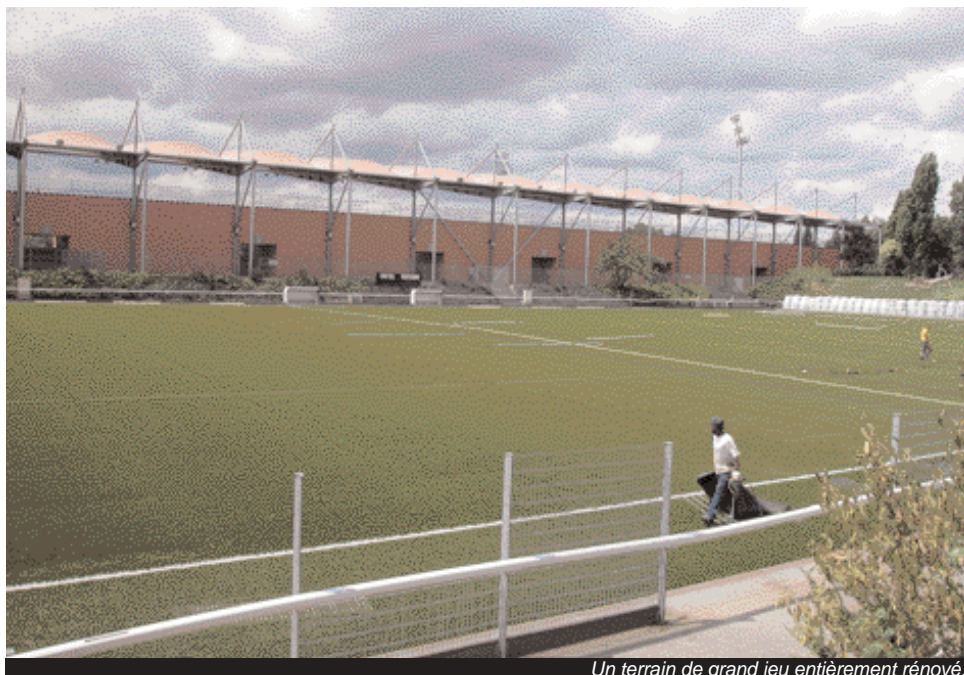
Un terrain de grand jeu entièrement rénové.